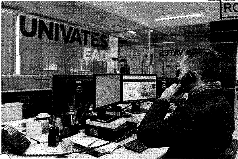
Central no prédio 3 da universidade dá suporte para os alunos