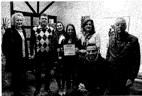
Encontro contou com a presença de ex-diretores e ex-secretárias do órgão ambiental

Esse foi o primeiro encontro que reuniu ex-diretores e secretários. “Mas a ideia é realizar novos encontros, também em locais externos, como o Jardim Botânico, o Aterro Sanitário e o Canil Municipal, locais construídos nas gestões passadas. O objetivo é, juntos, construirmos e lembrarmos todo o caminho e trabalho que a Sema já desenvolveu. Cada um dos ex-diretores e secretários contribuiu para o