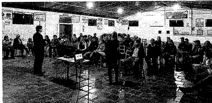
BAIRROS: comunidades e Administração mais próximas

Na ocasião, a comunidade apresentou suas