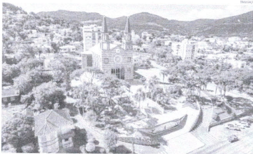
O ponto de encontro será em frente à Igreja Matriz São Pedro, no Centro da cidade

Conforme ele, ainda não há uma expectativa de quantas pessoas devem participar da atividade, entretanto, jovens de Serafina Corrêa, Muçum, Doutor Ricardo, Roca Sales, Lajeado, Arroio do Meio, Nova Brescia, além de Encantado, já confirmaram presença.