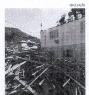
Com as reformas, o atendimento está suspenso por tempo indeterminado

O local está aberto das 7h30min às 11h30min e das 13h às 17h, de segunda a sexta-feira. Informações pelo telefone (51) 3705-1051.