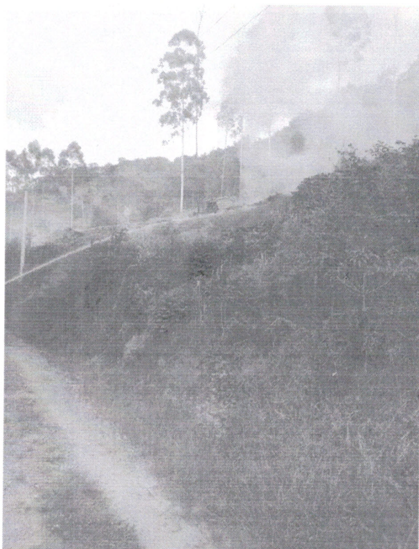
Fogo em Vegetação: Coqueiro Baixo