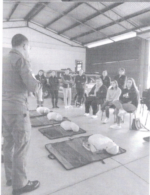
Instrução Primeiros Socorros Professores do ensino municipal Cidades de Putinga e Ilópolis.