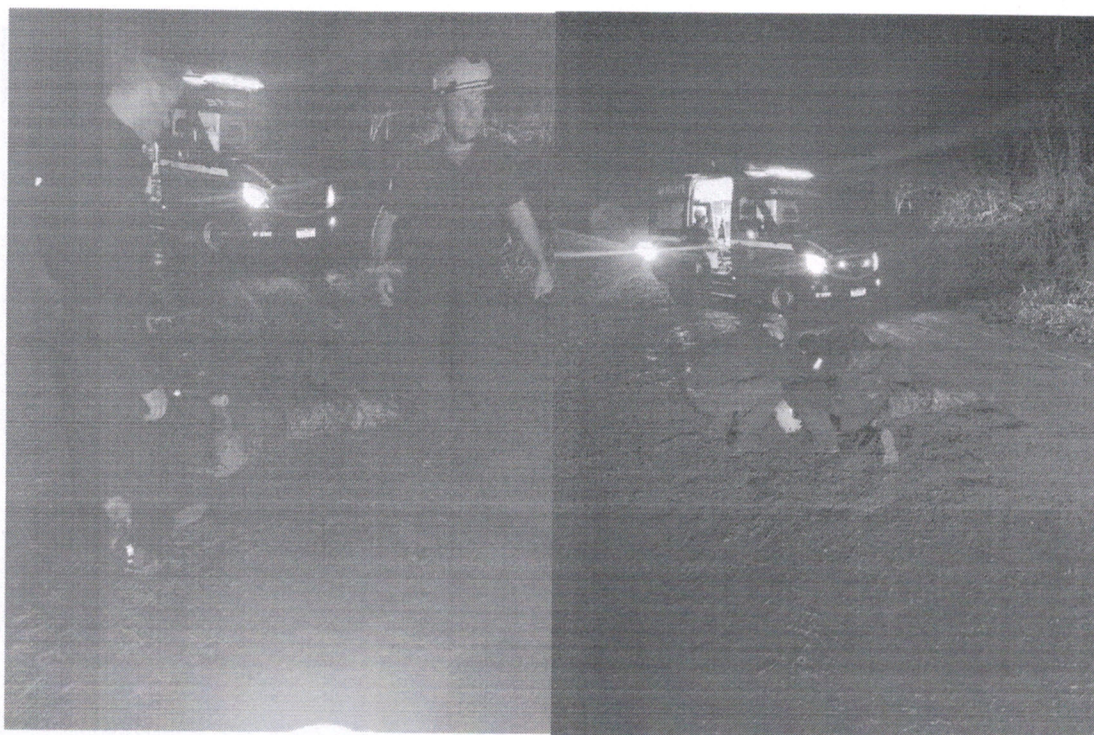
Acidente com Motocicleta (queda) Roca sales.