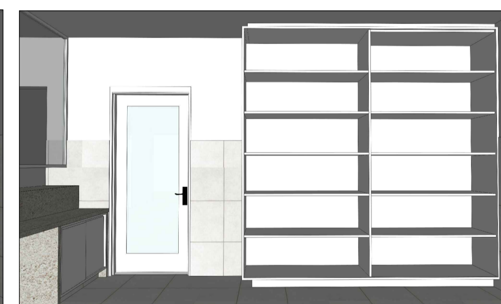
MÓVEL 02 (VISTA INTERNA)