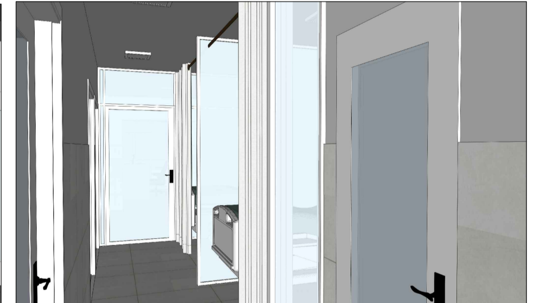
CORTINAS LEITO 01 E 02