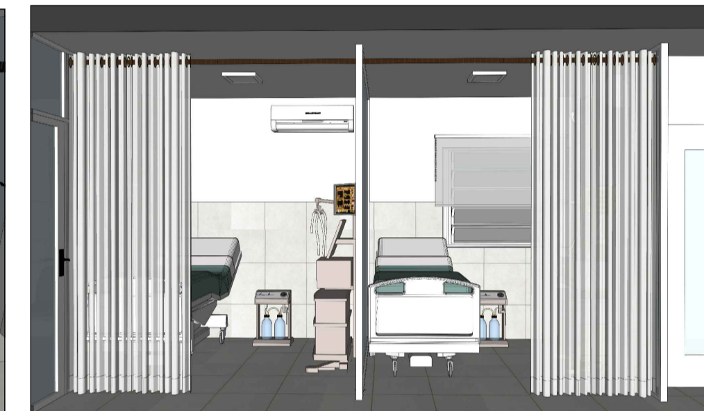
CORTINAS LEITO 01 E 02