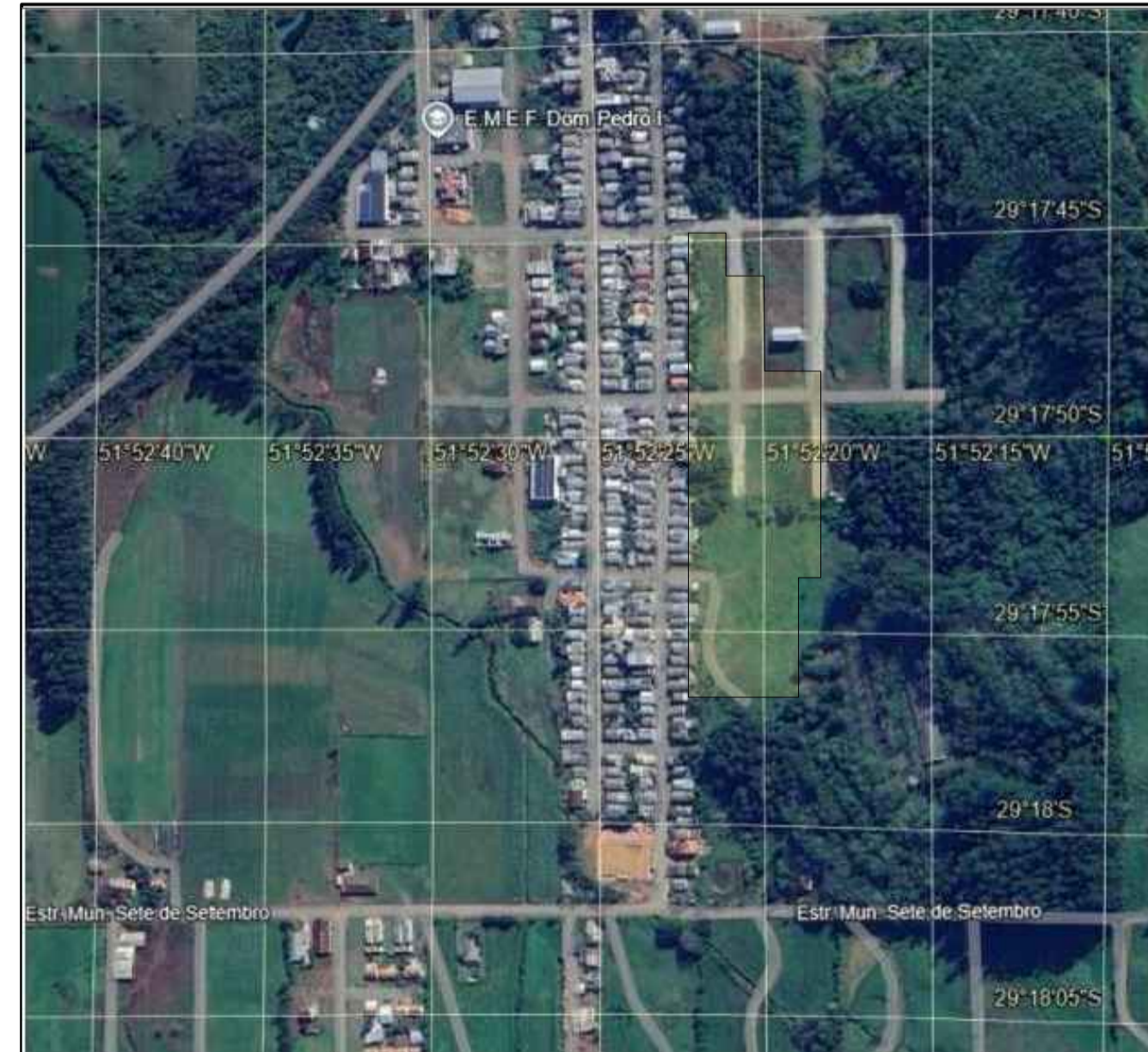
Localização dos Terrenos no Loteamento